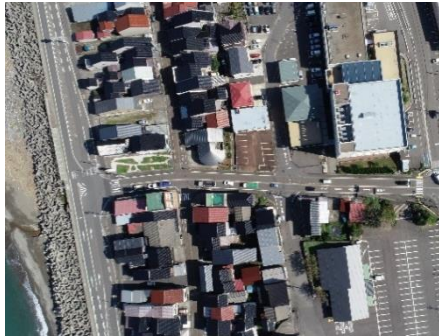
【着手前】 上空より (左側が日本海)

国道8号線から、北陸自動車道能生ICへと繋がる道路「能生インター線」。県からの発注で、交通渋滞を緩和するための改良工事を当社にて施工しています。現在、国道との接続部分の工事が終わりました。施工中は、交通規制等にご理解とご協力を賜りまして、ありがとうございました。