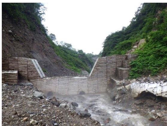
↑70～80m ほど下流にある、以前施工した谷止工。表面が丸太の、自然に溶け込むような姿です。

この日は、長さ 33m×高さ 7m×幅 3m～9m の谷止工を施工するための床掘作業中でした。降雪前の完成を目指し、安全第一で進めてまいります。