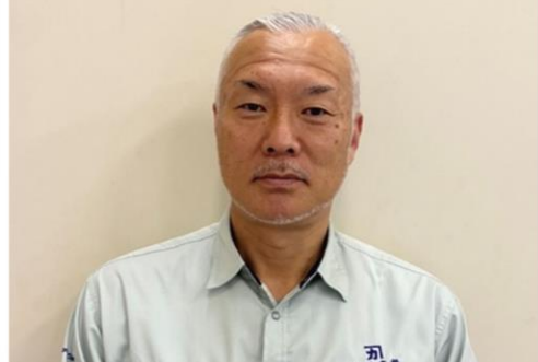
Nさん（リサイクルセンター）