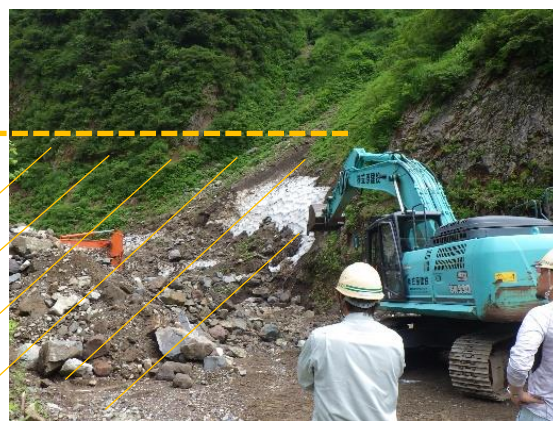
↑6月中旬時点では、点線辺りまで雪に覆われていました！除雪しなければ万年雪でしょうか？